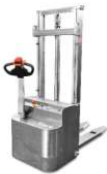
STARK IX 10