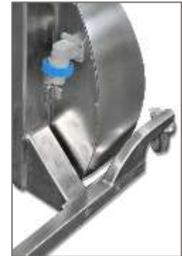
Caricabatteria automatico incorporato Internal battery charger

Acciaio INOX Aisi304 Portata 150 kg Batteria 24V Protezione IP56