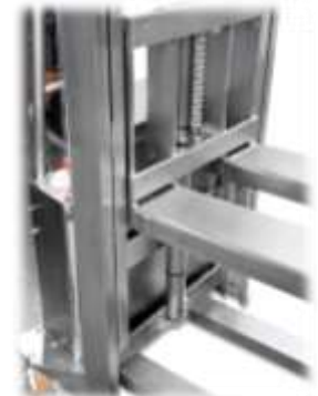
Pistone e forze in Acciaio INOX Stainless steel hydraulic jack and forks