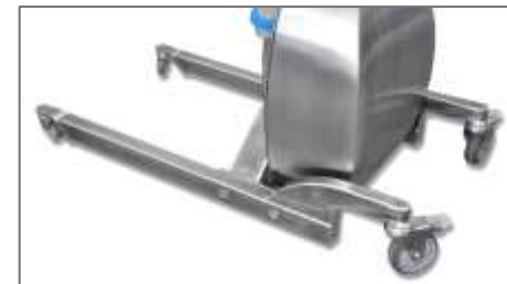
Tutte le ruote sono girevoli per la massima agilità All the wheels are pivoting for maximum agility

Stainless Steel Aisi304 Load capacity 150 kg Battery: 24V IP56 protection