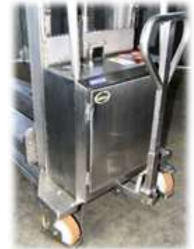
Timone collegato alle ruote (optional) Tiller connected to the wheel (optional)

Entirely made of Aisi304 stainless steel, it ensures the greatest hygiene and durability , even in the worst environments.