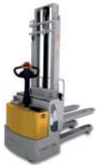
CEET DA 15 - 20