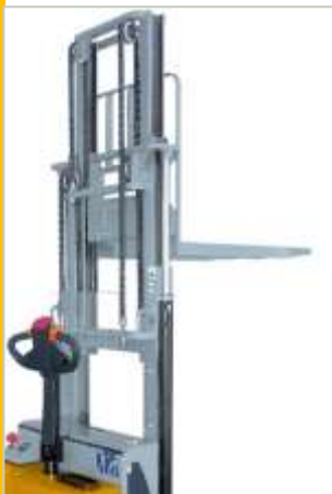
Castello di sollevamento Triplex (optional) Triplex mast (optional)

La robustezza del telaio e delle ruote laterali garantiscono la massima stabilità , specialmente durante lo stoccaggio su scaffalatura.