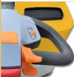
Comando alza/abbassa a joystick Joystick for up/down fork