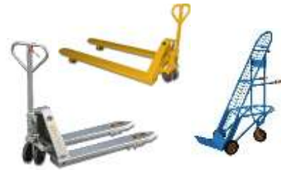
Hand pallet trucks - Others