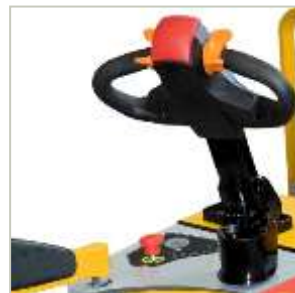
Sterzo servoassistito per maggior confort e sicurezza Power steering for increased comfort and safety

Puoi fare più lavoro nello stesso tempo . Motore di trazione di grande potenza (2,5 kW), con tecnologia AC e recupero dell'energia in frenata, esente da manutenzione .