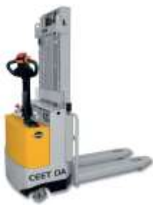
CEET DA 12