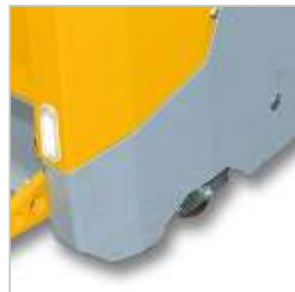
Sistema Track-Motion per la massima stabilità Track-Motion system for maximum stability

Load capacity 2,0t Battery: 24V up to 500Ah Max Speed 12 km/h