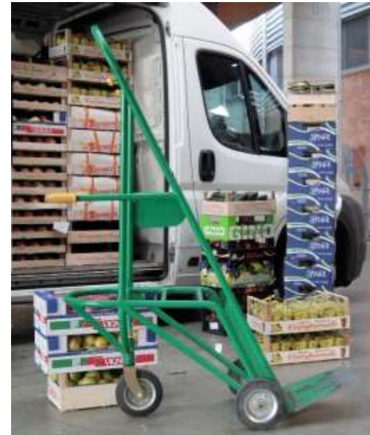
BICI all'interno di un mercato ortofrutticolo BICI inside a vegetable market