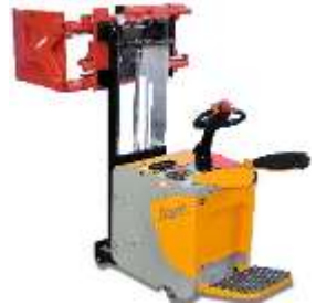
JIANT with CLAMPS