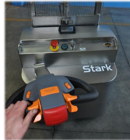
Semplice da guidare