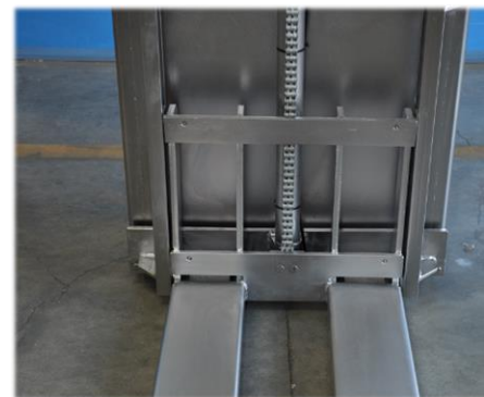
Completamente lavabile per la massima igiene